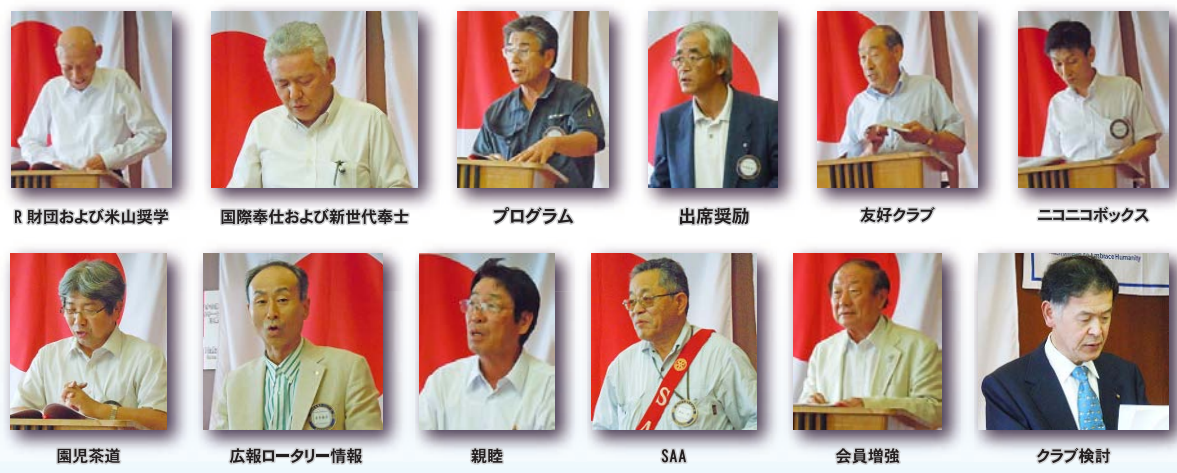
R 財団および米山奨学 国際奉仕および新世代奉士 プログラム 出席奨励 友好クラブ ニコニコボックス 園児茶道 広報ロータリー情報 親睦 SAA 会員増強 クラブ検討