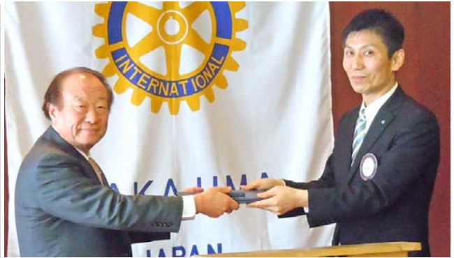
ポールハリスフェロー1回目おめでとうございます。これで晴れてロータリアンの仲間入りです。