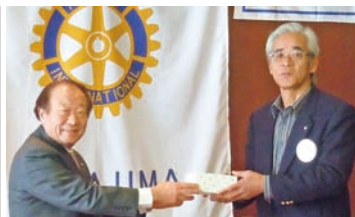
岩城君、お誕生日おめでとう。