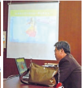
Türkiye Cumhuriyeti 卓話中の向君。奥様とはどこへ行くのも一緒です。Türkiye Cumhuriyeti 旅行記のお話でした。なぜかイスタンブールベリーダンスショーの動画から始まり、全く手ふれのない撮影法には疑いの目が。